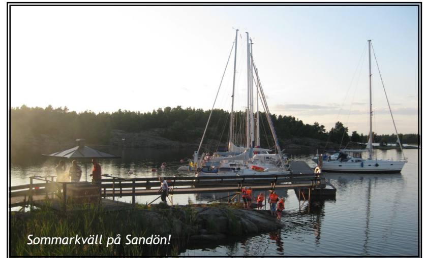
Sommarkväll på Sandön!